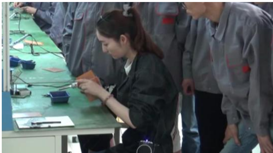
图 8：电子技术实景式教学场景