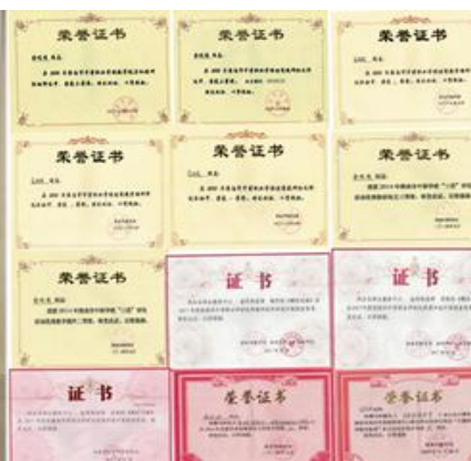
图 2：教师论文获奖证书