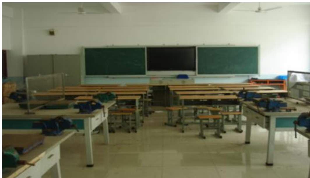
图 5：钳工理实一体化教室