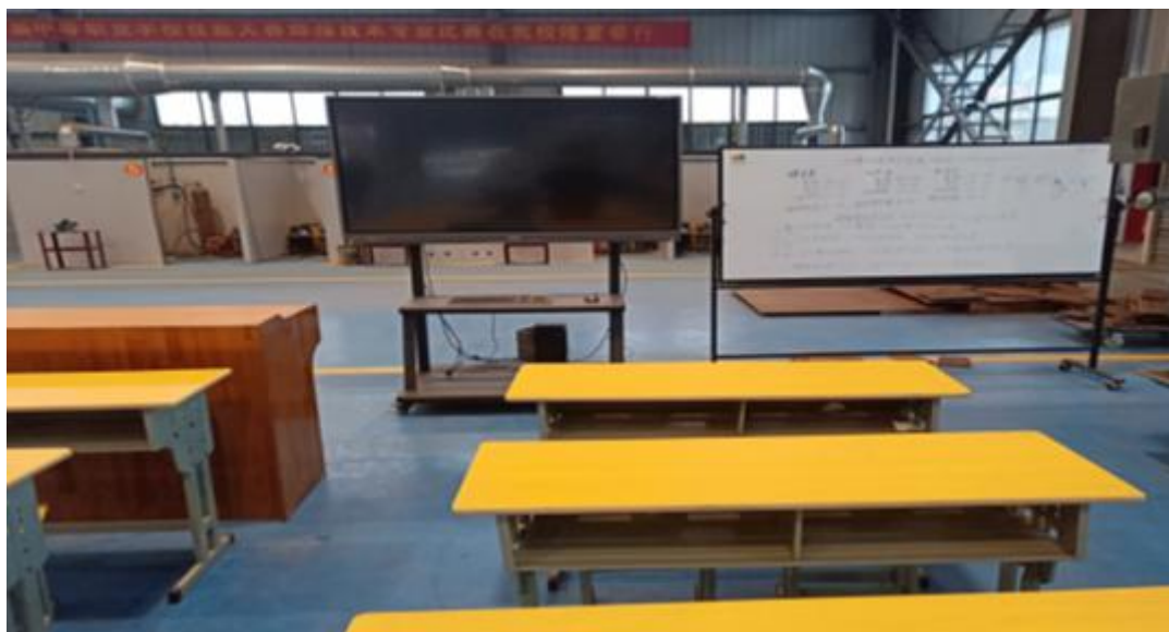
图 6：焊工理实一体化车间

4. 通过“理实一体化”教学，逐步实现了“教学做合一”的教育理念。通过理论联系实际，教学联系生活实践，学以致用，激发了学生学习本专业的兴趣，培养出社会需要的既懂理论又能动手干的技术工人。下面是学校开展实景式教学的部分场景。