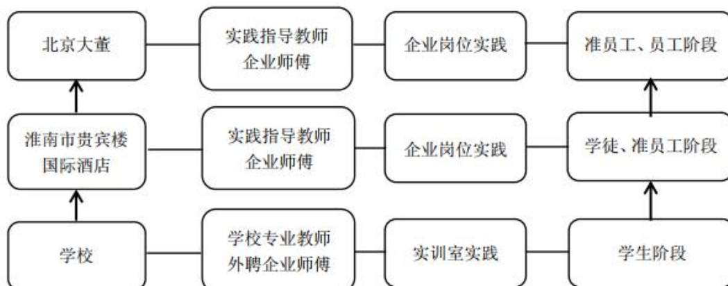
图 2：试点分段、企业分型