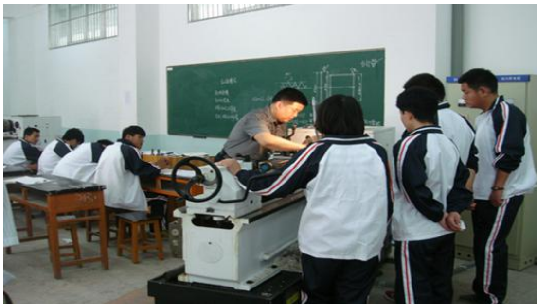
图 7：车工理实一体化教学场景图